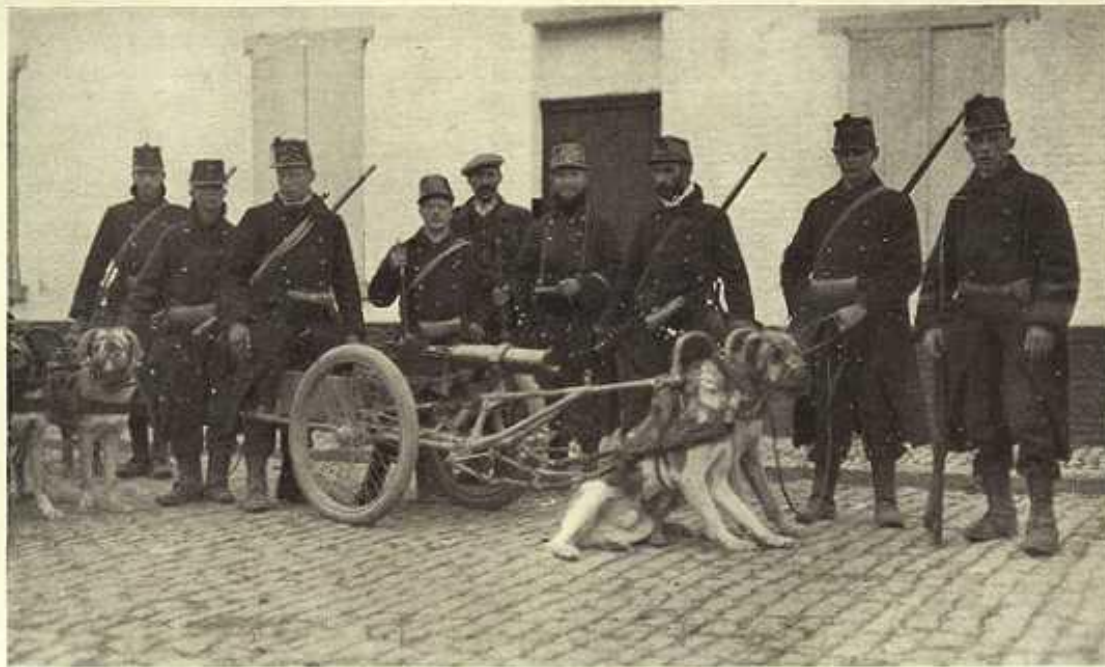
Belgian dog batteries. The machine-gun batteries drawn by dog teams rendered splendid service throughout the campaign in Flanders